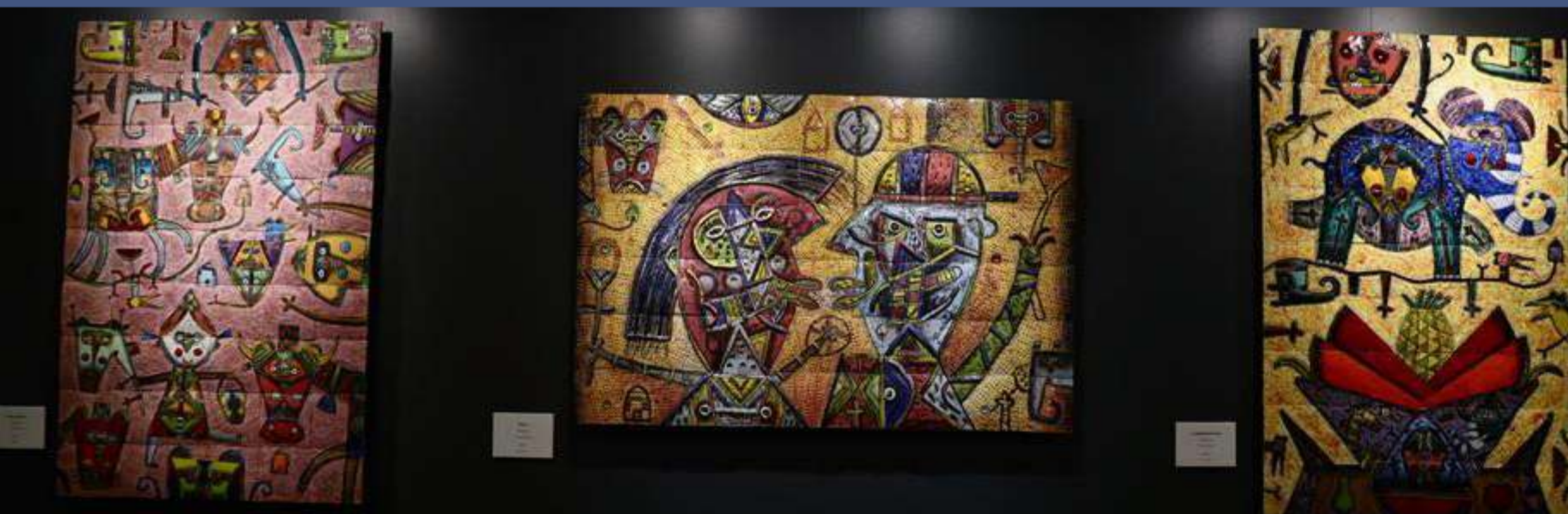
La imagen es de la galería Kunalá de la exposición «Los laberintos del color»

El proyecto de crítica de arte, tuvo como finalidad el análisis y la búsqueda de un conocimiento amplio, el cual ayudase a enriquecer el acervo cultural y científico de este tema, además de que sigue un marco teórico, por lo que se puede decir que su finalidad es de tipo aplicada. El fenómeno social que se analiza en este proyecto tiene como objetivo principal el análisis actual de la crítica de arte, por lo que es de tipo sincrónico. Su amplitud es monotemática, puesto que, se basa en un tema central, crítica de arte. Como se comentó en el aparato crítico, nos apoyamos en la recaudación de textos, en la realización de entrevistas para este proyecto, por lo que, según sus fuentes es del tipo mixta. La metodología de este proyecto se basó en primera instancia en la observación del fenómeno, para posteriormente analizarlo y finalmente dar conclusiones de lo que observó y analizó, por lo que su metodología es del tipo cualitativa. El marco de investigación es de campo, y es un informe de caso porque analiza una situación en específico, en un espacio-tiempo bien determinado